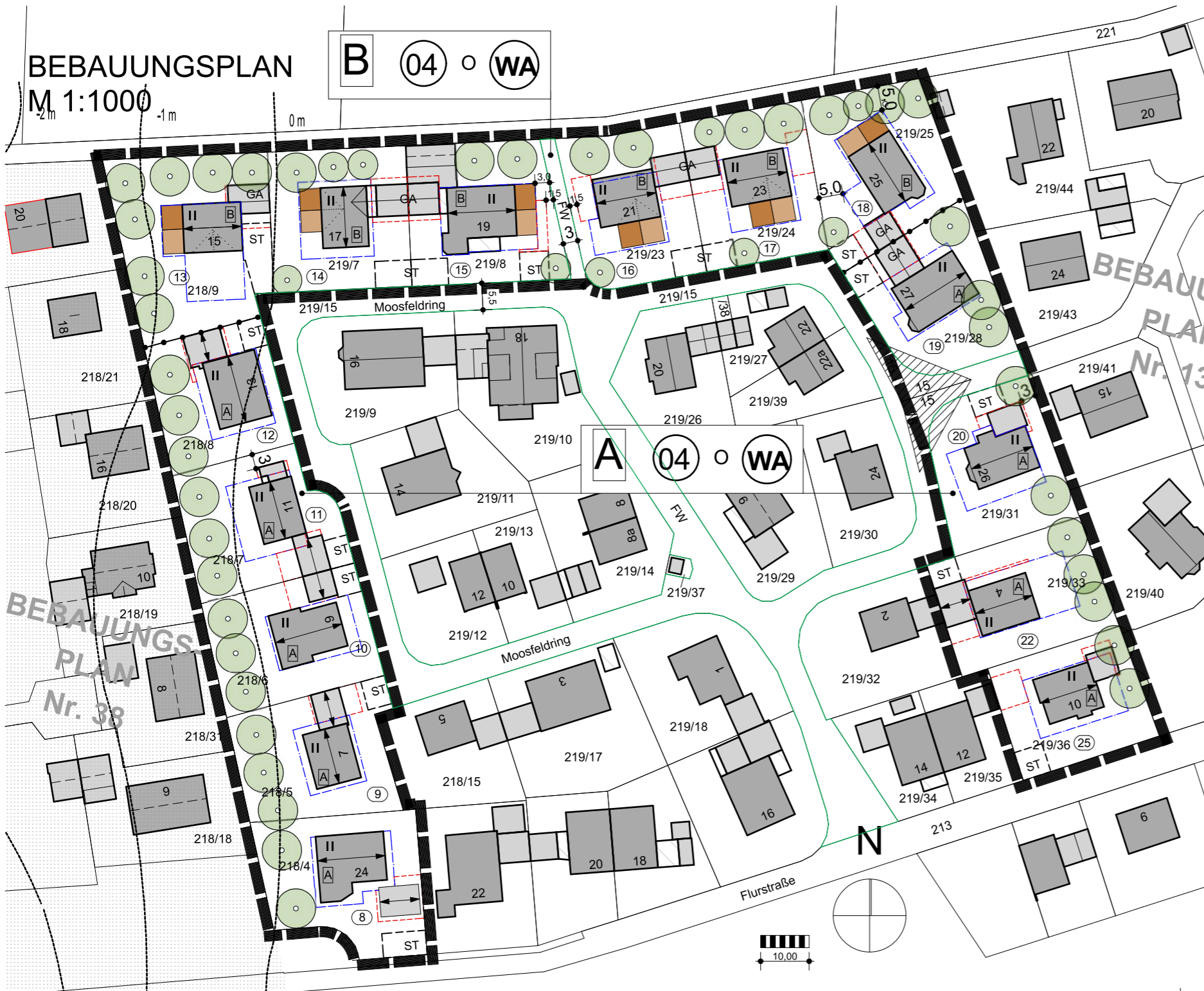
BEBAUUNGSPLAN M 1:1000

"Heldenstein Nord" (Bereich Moosfeldring) Allgemeines Wohngebiet WA